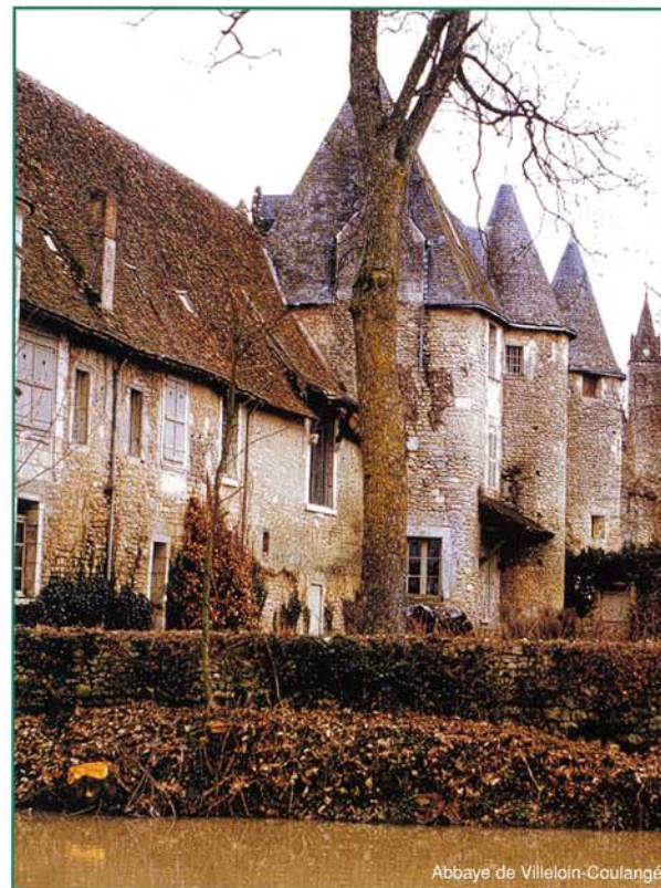
Abbaye de Villeloin-Coulangé