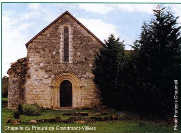
Chapelle du Prieuré de Grandmont-Villiers

En 1790, l'abbaye ferma et ses quatre derniers religieux la quittèrent. Les Bâtiments, rénovés quelques années auparavant, furent en partie démolis.