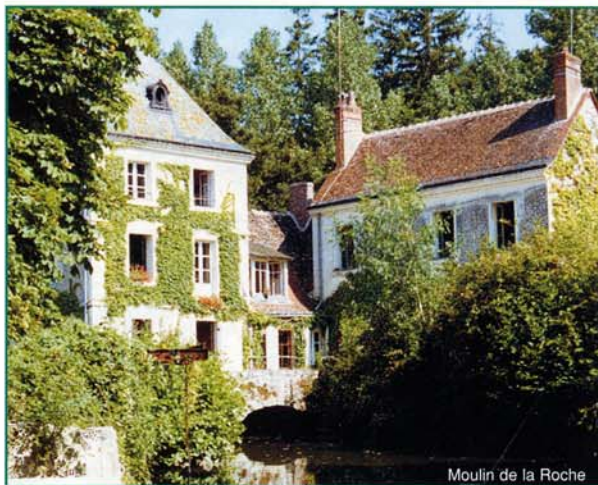
Moulin de la Roche

Grande commune du Val d'Indrois fut occupée dès le Néolithique. Les Romains en firent une place forte. Au VII e siècle, on y frappait la monnaie. Adam Fumée, médecin de Charles VII et Louis XI, fut le premier seigneur connu. Il fit reconstruire l'église Sainte Eulalie (XII et XVI e s.) et commença à édifier le château. Ensuite, la famille de Menou posséda le fief de Genillé jusqu'à la révolution. Elle fut à l'origine du manoir et de l'abbaye de la Bourdillière et remania le château de Fumée. C'est aussi à Genillé que naquit Michel de Marolles, abbé de Villeloin, écrivain et surtout collectionneur d'estampes. De nombreux châteaux (privés) et aménagements troglodytiques disséminés au gré des vallons, constituent avec la forêt souvent présente, l'attrait de nombreuses promenades.